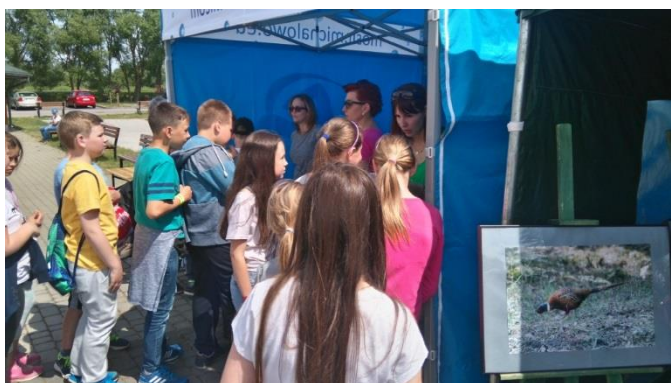
Bezpieczne wakacje w Michałowie

Celem tych akcji jest promocja spożycia mleka. Ich uczestnicy dowiadują się m.in. jak ważne dla zdrowia jest picie mleka i jedzenie produktów mleczarskich.