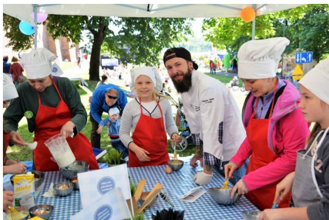
Mleczne Piknikowe Śniadanie w Toruniu