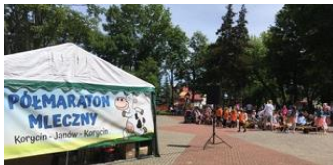
Półmaraton w Korycinie.

Więcej informacji na stronie PIM pod linkiem: http://izbamleka.pl/